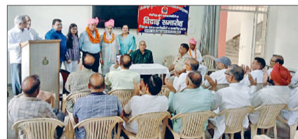
फतेहाबाद। सेवानिवृत्त पुलिस अधिकारियों को विदाई देते कर्मचारी।

5 पीड़ित मौके पर हाजिर मिले, जिन्हें स्वास्थ्य विभाग, आयुष व होम्योपैथिक विशेषज्ञों की मदद से गहन काउंसलिंग दी गई और होम्योपैथिक व आयुर्वेदिक दवाएं वितरित की गईं, वहीं 2 अन्य पीड़ितों के परिजनों ने बताया कि वे अब पूरी तरह नशा छोड़ चुके हैं और सामान्य जीवन व्यतीत कर रहे हैं। इसके अतिरिक्त रतिया क्षेत्र के 4 नव चिन्हित पीड़ितों को भी स्वास्थ्य विभाग के सनवच्य से नागरिक अस्पताल फतेहाबाद से दवाएं उपलब्ध कराई गईं। अभियान के दौरान टीम ने ग्रामीणों को नशे के दुष्परिणामों के बारे में जागरूक किया।